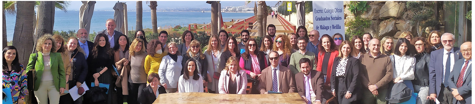
Desayuno celebrado en Marbella, 11 febrero