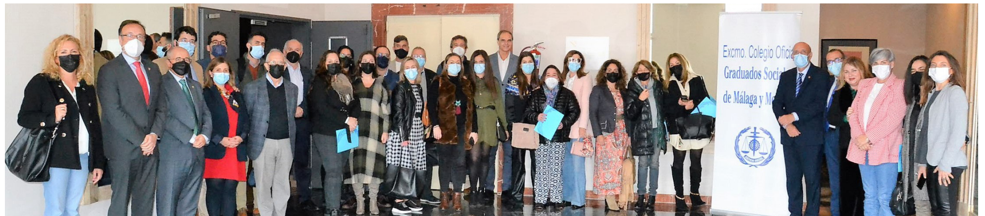
Desayuno celebrado en Benalmádena, 11 marzo